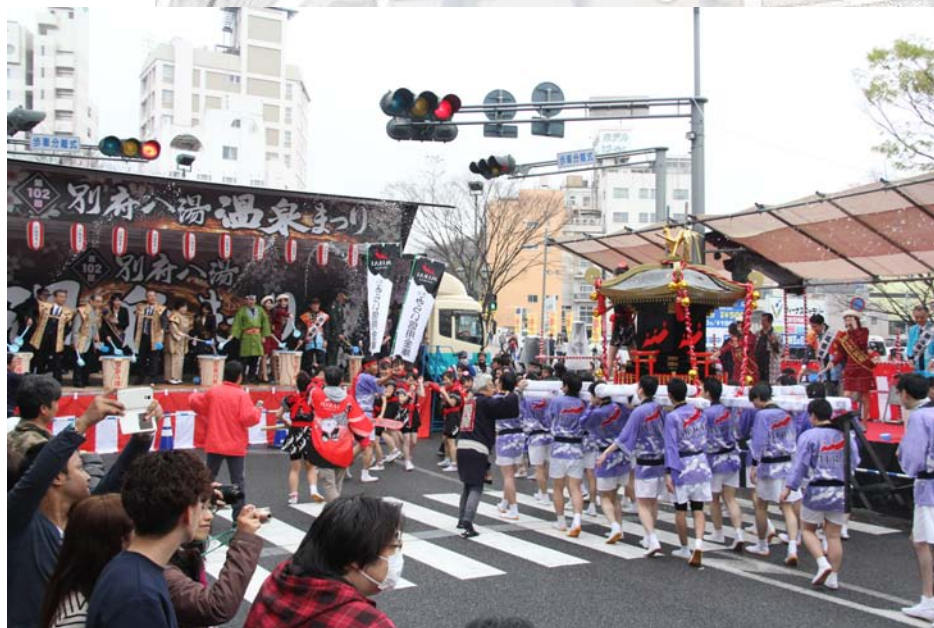
昨年度 湯かけステージ周辺の様子

■湯かけ神輿 設置場所:北浜公園 北浜公園から、スタート地点となる別府駅前通り「ソルパセオ商店街」前まで神輿を担いで移動いただきます。